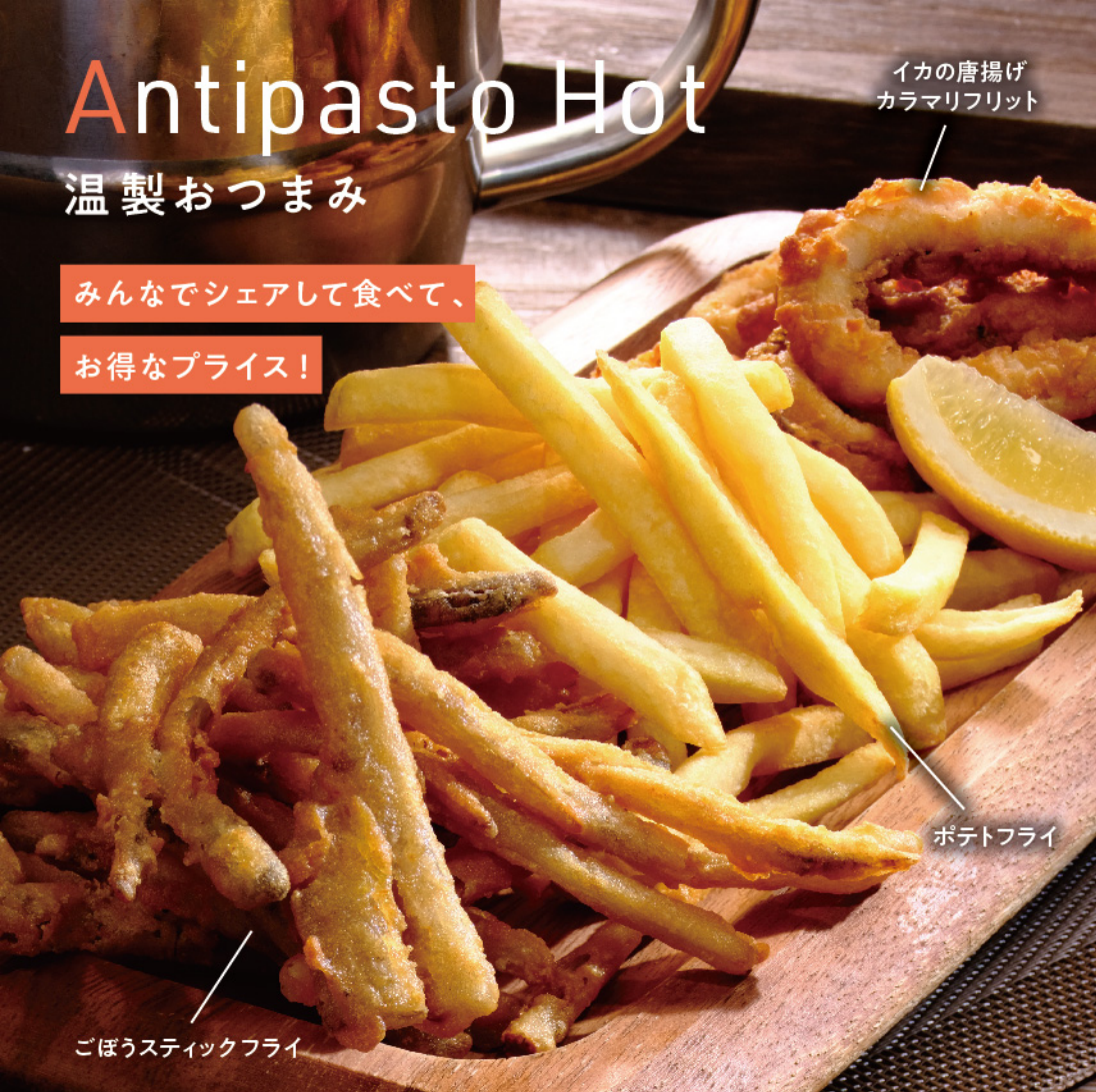
イカの唐揚げ カラマリフリット