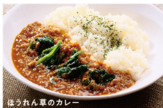
ほうれん草のカレー