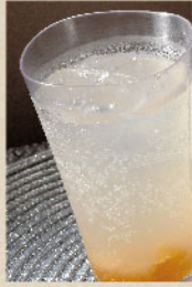
白桃サワー Peach Sour