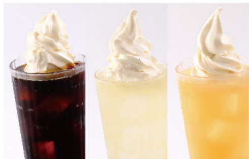
コーヒーフロート レモンスカッシュフロート オレンジフロート