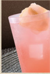
ピンクジンジャー サワー Ginger sour