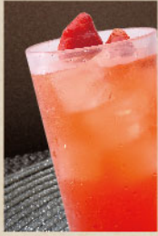
あまおうサワー AMAOH Sour