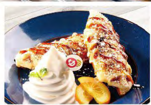
カラメルブリュレ