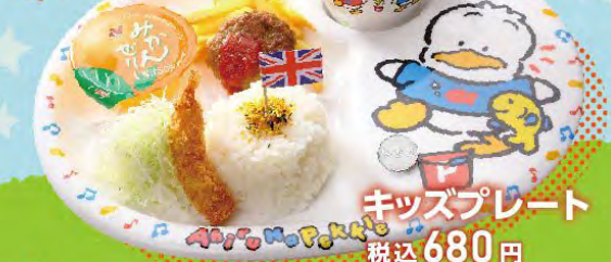
キッズプレート 税込680円