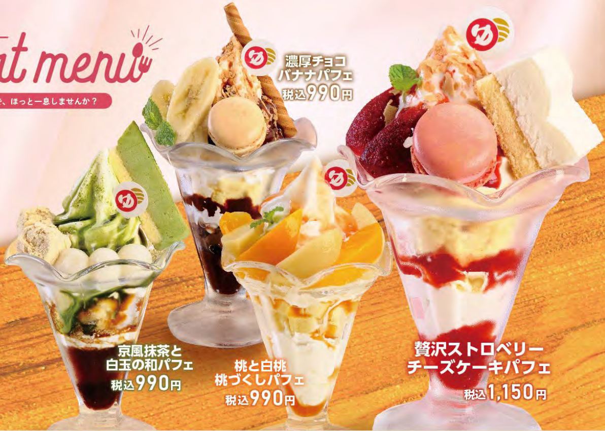
京風抹茶と 白玉の和パフェ 税込990円