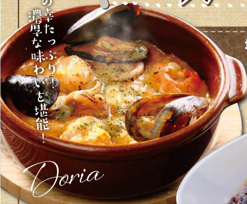
地中海風トマトクリームドリア