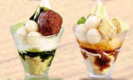
しゅまり小豆 黒蜜きなこ