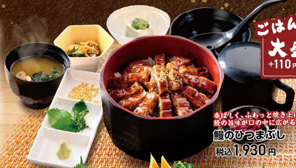
香ばしく、ふわっと焼き上げた鰻の旨味が口の中にかかる 鰻のひつまがし 税込1,930円