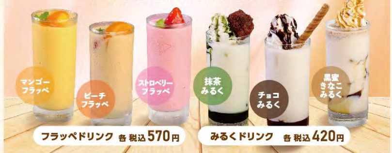
マンゴー フラッペ