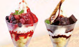
トリプルベリー チョコレート