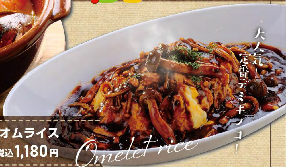
きのこのデミソースオムライス