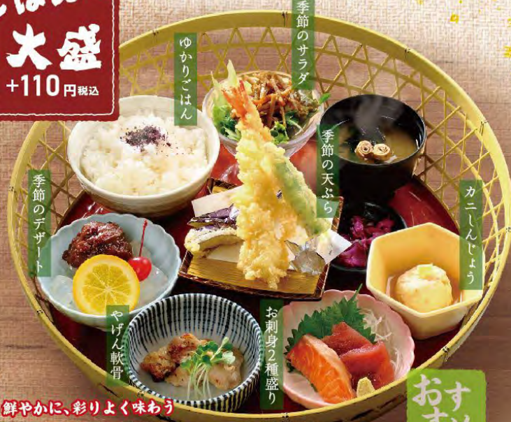
鮮やかに、彩りよく味わう 和風花籠御膳 税込1,880円

小鉢を花のように籠に詰め合わせ、見た目も華やか。少しづつ様々な食材を楽しめる豪華な御膳をご用意しました。 ※デザートは時期により変更いたします。