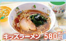
キッズラーメン 580円