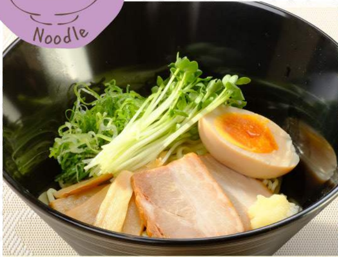
油そば 温 780

野菜をしっかり摂れるちゃんぽんやまぜておいしい油そば、つるつとしたのど越しが特徴の稲庭風うどんをお楽しみあれ。