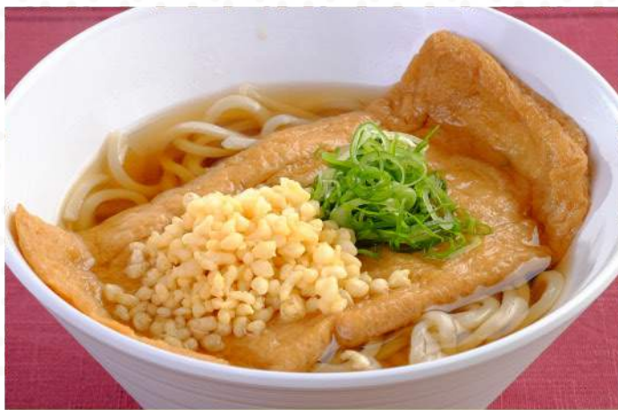
きつねとたぬきのばかしうどん 温 680