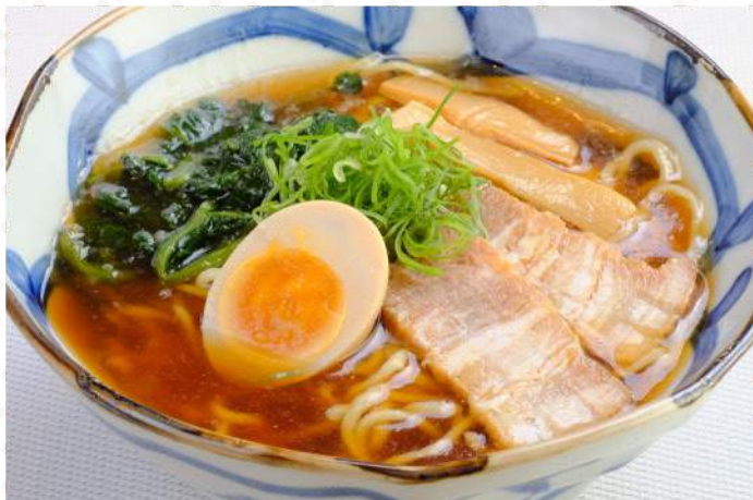
味玉醤油ラーメン 温 780