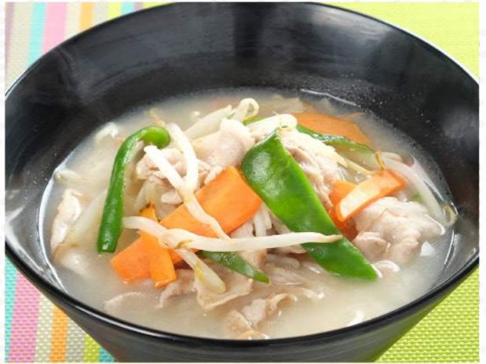
野菜たっぷりちゃんぽん 温 780